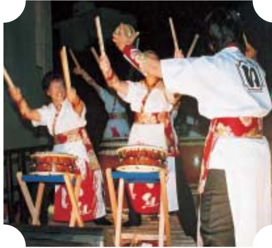
生のと迫力 広田村鼓舞姿の皆さん