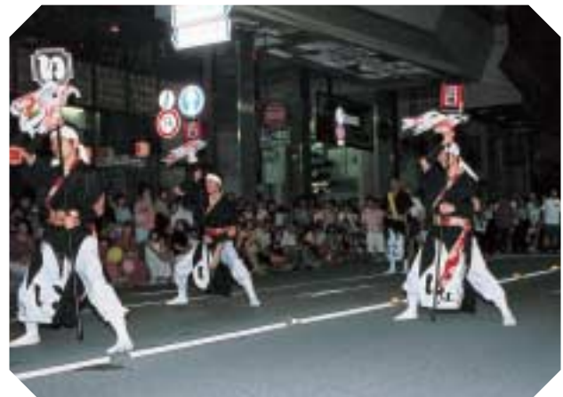
まといを持つ手に気合いが入る！