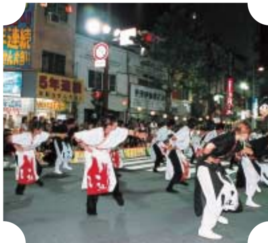
これがわしらの野球拳