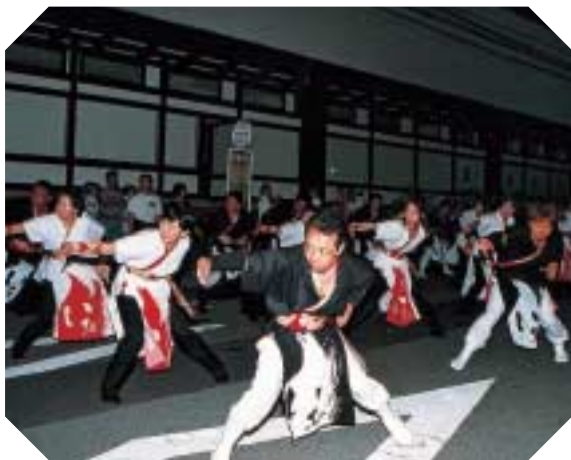
一糸乱れぬこの動き