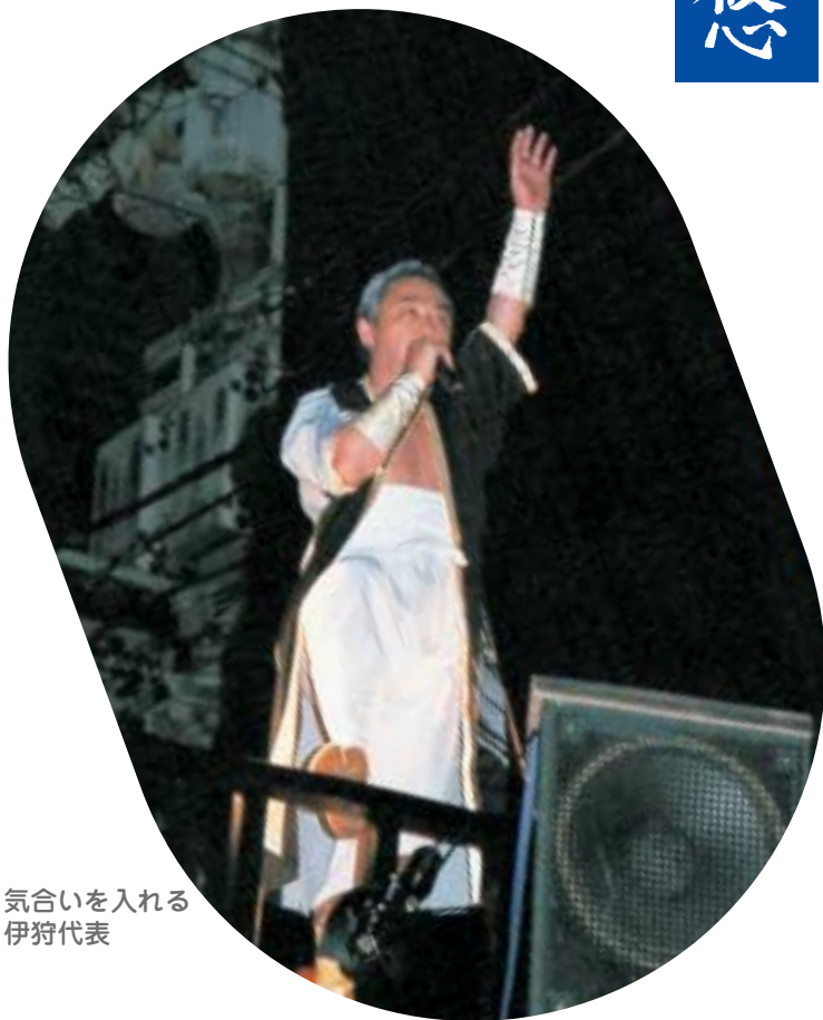
気合いを入れる 伊狩代表