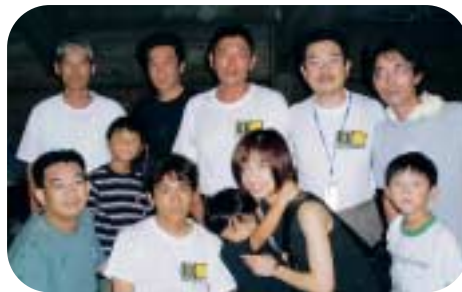
マドンナ2人に囲まれる審査員