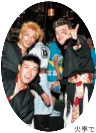
火事でも何でも負けへんでえー