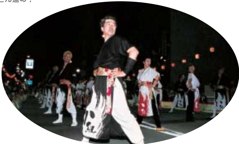
これから個人技の見せ場やで！