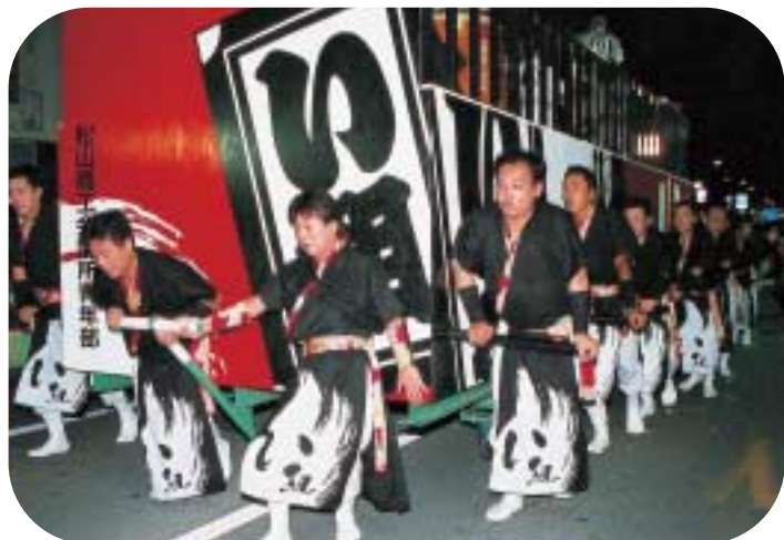
山車を操るサポート隊