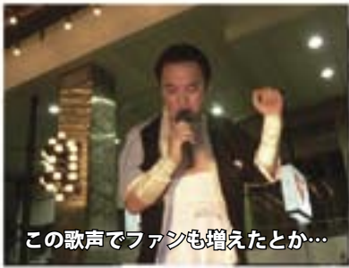
この歌声でファンも増えたとか…