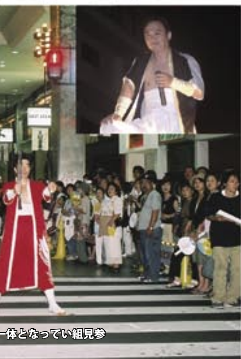
一体となってい組見参