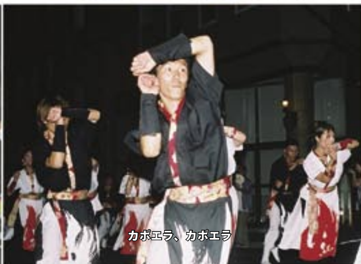
カポエラ、カポエラ