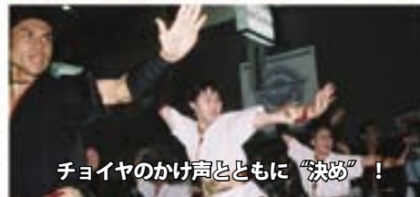
チヨイヤのかけ声とともに“決め”！