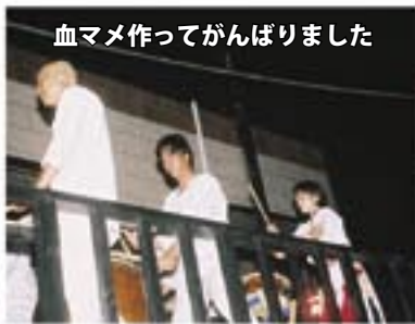
血マメ作ってがんばりました