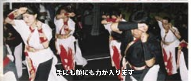
手にも顔にも力が入ります

皆さん、 ありがとうございます。 「見るおどり」から 「踊るおどり」へ 「感動は伝わります」 毎年毎年、 活気あふれるい組に、 そして松山まつりに なってきました。 これからも、 よろしくお願いいたします。