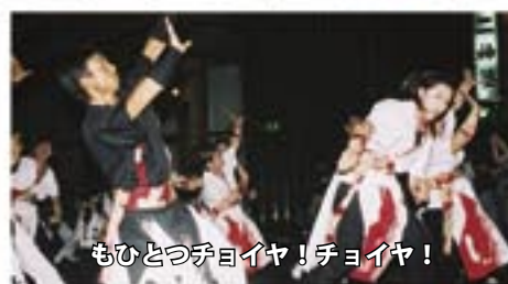
もひとつチヨイヤ！チヨイヤ！