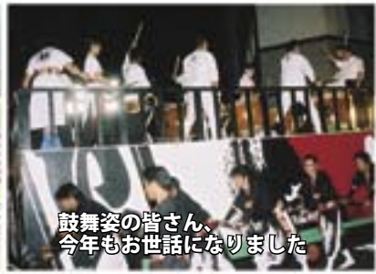
鼓舞姿の皆さん、今年もお世話になりました