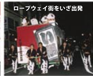
ロープウェイ街をいざ出発