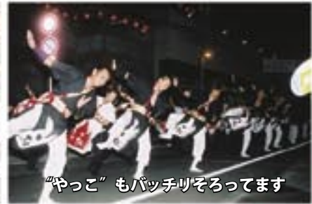
“やっこ”もバッチリそろってます