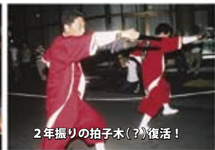
2年振りの拍子木(?)復活！