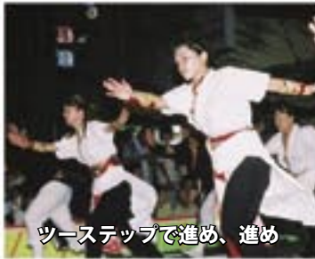
ツーステップで進め、進め