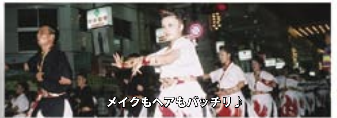
メイクもヘアもバッチリ♪