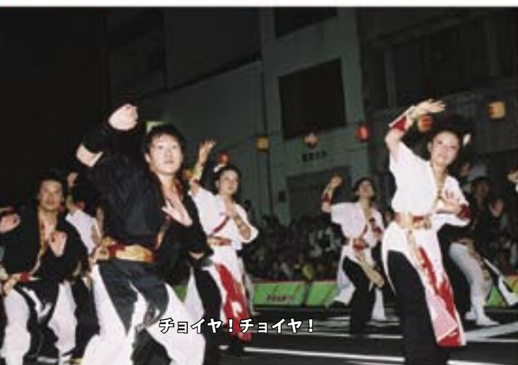
チヨイヤ！チヨイヤ！