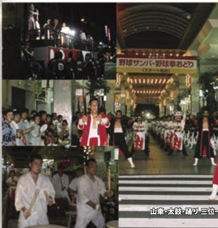
山車・太鼓・踊り三位一