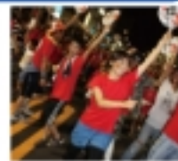
松山まつり「松っちゃん達」

地域を住みよく楽しくすることは、それぞれの家族がいきいきと生活するため、経営活動をスムーズにするための基盤となります。私たちは「松山まつり」への協力を通じて、地域づくりに貢献しています。