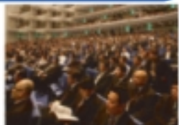
松山で開催された全国大会

松山のYEG会員は約180人、それぞれが協力しつつ地域経済の活性化を目指しています。また松山のみならず日本全国には約3万人の会員がいます。地域と全国、それぞれのビジネスが広がるきっかけがあります。