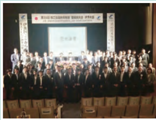
78名で参加しました