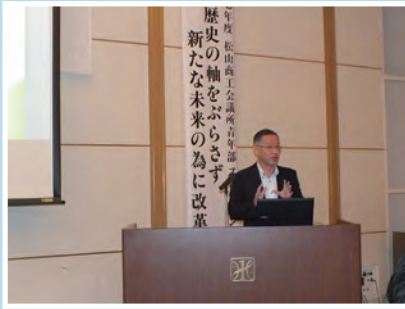
繁盛塾はマイナンバー制度について