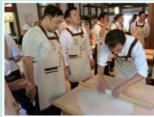
分科会ではピザ作りや地引網を体験