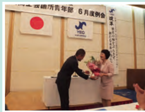
例会事業はビジネスマナーについて