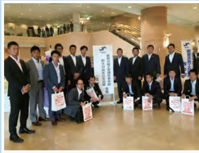
17名で参加しました