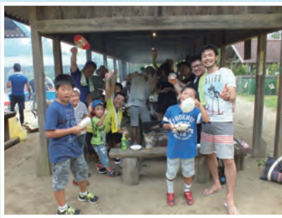
優勝は未来企画員会 !!