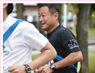
A チームは 15 位、B チームは 153 位