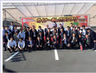
57名で参加しました