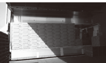
県連からも、3月19日(土)の午前中にトイレトーパー400箱(38,400ロール)が会津若松に向けて出荷されました。