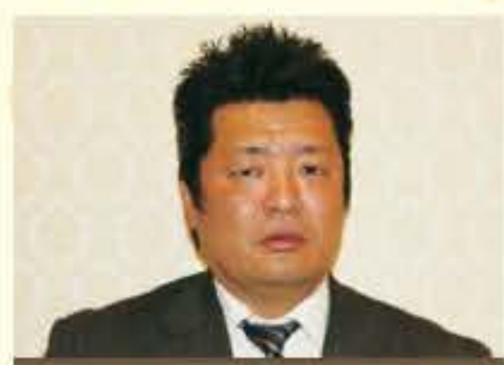
地域活性化委員長

① B型 ② 人を喜ばせること ③ そうラーメン ④ 飲んだぶりします。 座右の銘 「なでして JAPAN！」