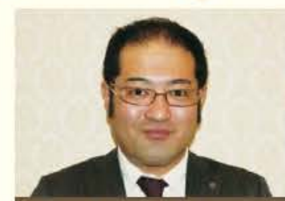
地域連携(特別委員会)委員長

① A型 ② スポーツ ③ お肉 ④ たまに呑まれます 座右の銘 「懐けは人の為ならず」